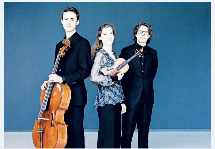
Van Baerle Trio.